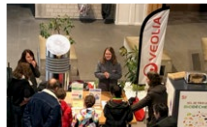
Festival Alsascience au lycée agricole