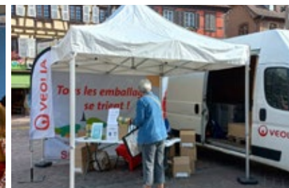
Distribution de sacs de tri et biodéchets