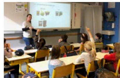
Sensibilisation au tri à l'École Picasso