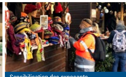
Sensibilisation des exposants sur le Marché de Noël